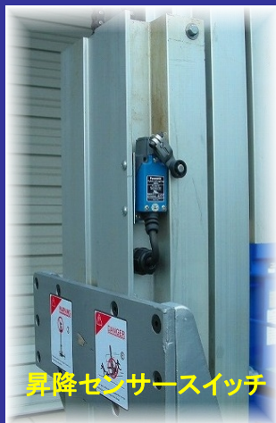
昇降センサースイッチ